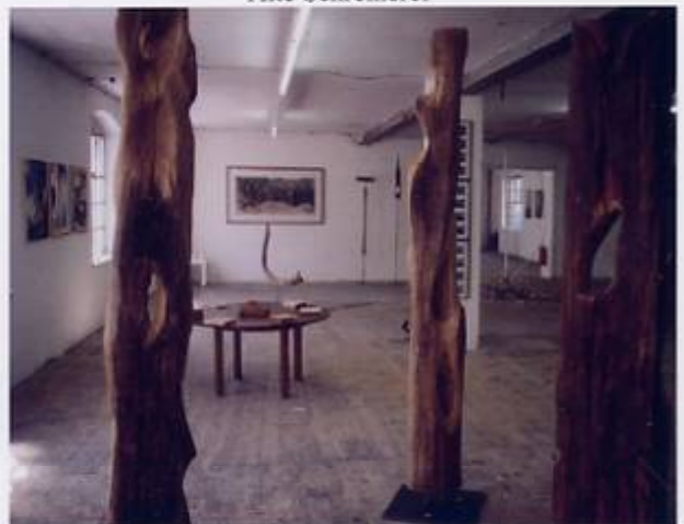
im Vordergrund eine Skulpturengruppe von R. Heinrichmeyer