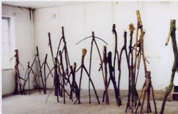
"Odins wilde Jagd", Wolfgang Steininger