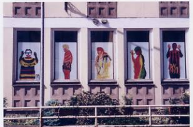
5 Fenster (ehem. Späth-Hotel) der Aktion „Schau an!“